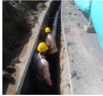
carrera 18 entre calles 38a y 50