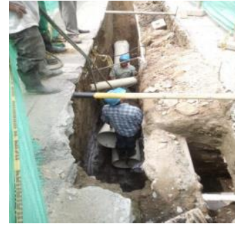
Tanque 5 en el sector de las Américas