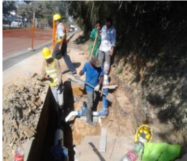
Av. centenario -Batallón N° 8 y la calle 13N

$ 2.875 Millones en la construcción y/o reposición de 3.783 Metros lineales de redes de Acueducto aproximadamente.