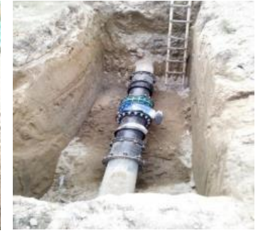
Tanque 6 desde el barrio el Prado