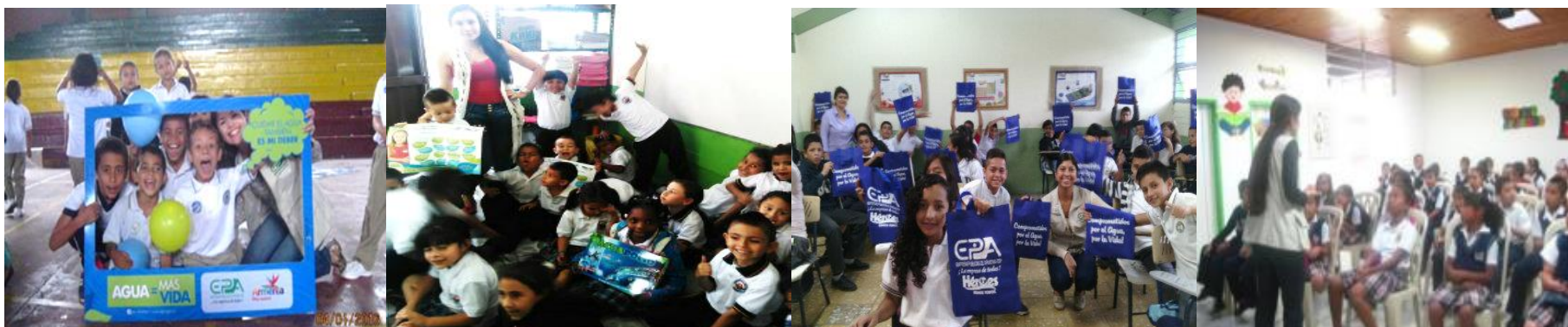
Estudiantes sensibilizados en Uso eficiente y Ahorro del Agua