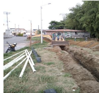
Quintas de los Andes, La Patria mz 22, Gran Bretaña mz 4, CR 19A 29-112 y Av Bolívar 44N