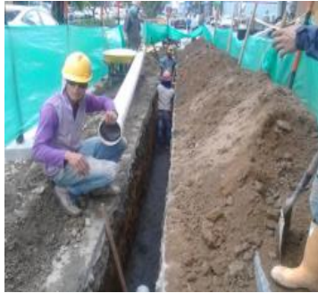
Carrera 19 entre calles 9 y 12